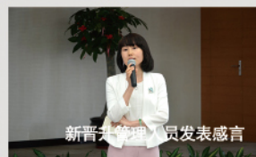
新晋管理人员发表感言

本刊讯 4月30日，集团在五一劳动节来临之际，举行集团中心全体员工大会，正式宣布集团全新架构调整和相关人事任命的同时，激励全体员工拥抱新变化，开拓新思维，主动迎合集团“变革与改革”需求，争做集团全新战略下的奋斗者，以赢得集团与个人的共同成长。