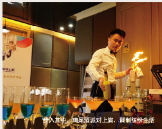
步入其中，鸡尾酒派对上演，调制缤纷生活