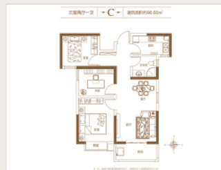
创新三居设计，建筑空间零浪费，诠释雅致生活格调；

餐客双厅相连，搭配观景阳台，全视野景观尽在眼底；南向主卧，搭配阔景飘窗，赋予生活浪漫温馨色彩；独立书房预留，未来可根据主人喜好随心打造