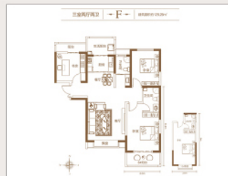
阔绰三居布局，打破空间限制，满足奢适生活所求；客厅/餐厅/厨房/生活飘窗一线相连，大美尽揽；南向阔绰主卧，搭配超大阳台，尽享精致人生；豪华双卫，干湿分离，细节处

餐客双厅相连，搭配观景阳台，全视野景观尽在眼底；南向主卧，搭配阔景飘窗，赋予生活浪漫温馨色彩；独立书房预留，未来可根据主人喜好随心打造