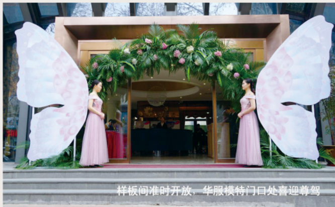
样板间准时开放，华服模特门口处喜迎尊驾

3月9日，泉舜上城【一城春色·泉景盛放】网红样板区盛大开启。借由“一环正央、双地铁口”的绝对优势，在短短一天时间内便吸引超千人到访，再一次证明了泉舜的品牌向心力和产品打造力！