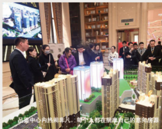
品鉴中心内热闹非凡，每个人都在施展自己的创意脑洞